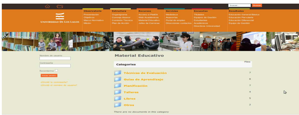
Figura 5: Acceso a encuestas