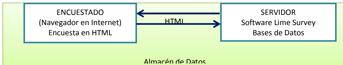
Figura 1. Interacción Cliente-Servidor en encuestas online