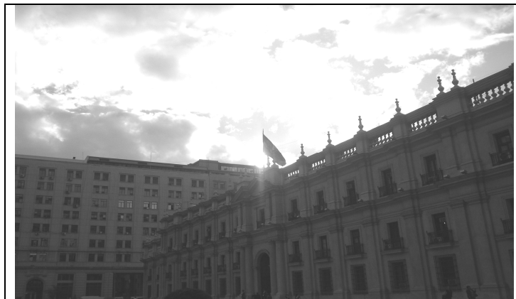
Figura 8. ¿Qué significado tuvo para nosotros la investigación sobre el Palacio de Gobierno?