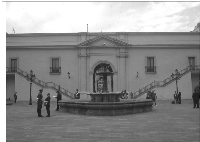
Figura 4. Alumno en el interior del Palacio, ¿Qué nos llama la atención el Patio de los Cañones?

El uso de las TIC's en nuestra asignatura debiera conducirnos, según lo planteado en Román (2000), a un modelo de aprender a aprender como desarrollo de capacidades y valores por medio de contenidos y métodos/procedimientos. Desde esta perspectiva las actividades han de entenderse como estrategias de aprendizaje orientadas a la consecución de los objetivos (capacidades y valores). Esto último implica de hecho un enseñar a aprender y enseñar a pensar, aunque para ello sea necesario de nuevo aprender a enseñar.