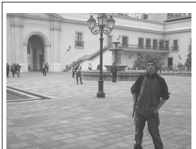
Figura 7. Alumno en el interior del Palacio, ¿Qué importancia tiene el Patio de los Naranjos?

Esta metodología de trabajo implica una información clara a los estudiantes, indicando los pasos o etapas que se deben seguir para desarrollar las destrezas, según indica Loo (2005) estos elementos son fundamentales, ya que podríamos tener la intención de enseñar una cierta herramienta, enunciarla a los alumnos y luego pedirles la tarea planificada sin nunca haberles explicado como debían proceder.