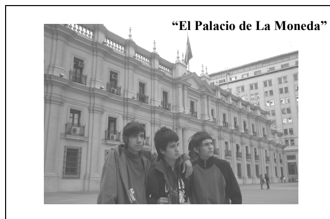
Figura 2. Comienza la aventura: Primera diapositiva expuesta por estudiantes de Segundo Medio, a sus compañeros. Tomada en el Frontis del Palacio de la Moneda, punto de partida del trabajo propuesto.

Actualmente se considera al aprendizaje un proceso activo, Vigotsky (1996) se refiere al tema en el sentido de que son los jóvenes los que construyen sus propias comprensiones del mundo, este proceso puede ser apoyado a través de la discusión, reflexión o exploración; en otras palabras, los estudiantes no toman las ideas, sino que ellos las construyen. Por ejemplo, la idea previa que pueden tener los estudiantes de un edificio histórico, se puede contradecir con la historia oficial del mismo, sin embargo, cuando realizan una visita, investigan y conversan con algún funcionario que los ayude, ellos re-elaboran sus ideas, desarrollando nuevas ideas del mismo, generando aprendizaje (Figura N° 2).