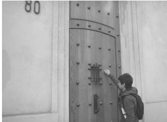
Figura 5. Alumno en entrada por Morandé 80. ¿Por qué esta entrada es más nueva que las otras?

Este proceso de incorporación de la innovación, llevaría al docente a generar nuevas metodologías, donde debiera incorporar horas en el Laboratorio de TIC's de la unidad educativa o bien el proponer el uso del PC e Internet como parte del trabajo fuera de clases. De este modo, también afecta la gestión curricular, ya que U.T.P. y Dirección deberán implementar acciones tendientes a la modificación y adaptación de los horarios, profesores, cuidado de los PC, etc.